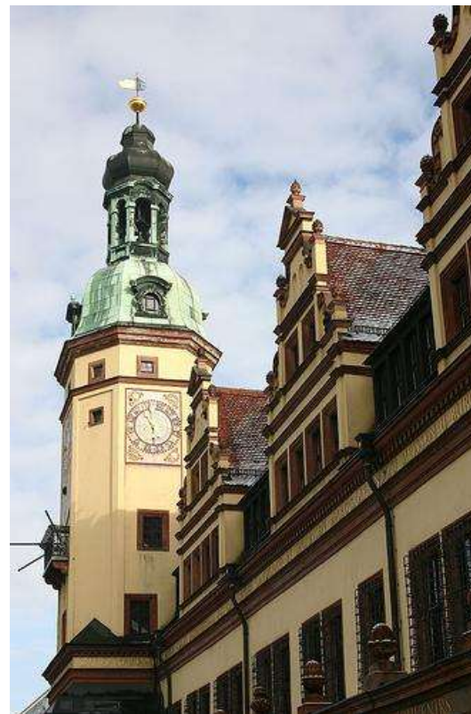
Экскурсия по Лейпцигу